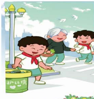
彬彬有礼 仁德有序